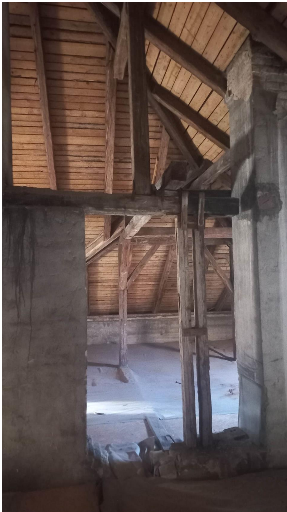
Obr. 3 – fotografie krovu