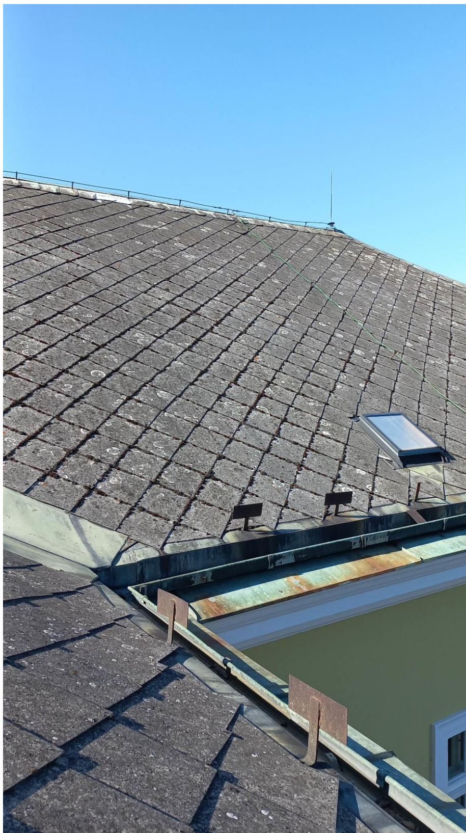
Obr. 8 – fotografie střešního pláště