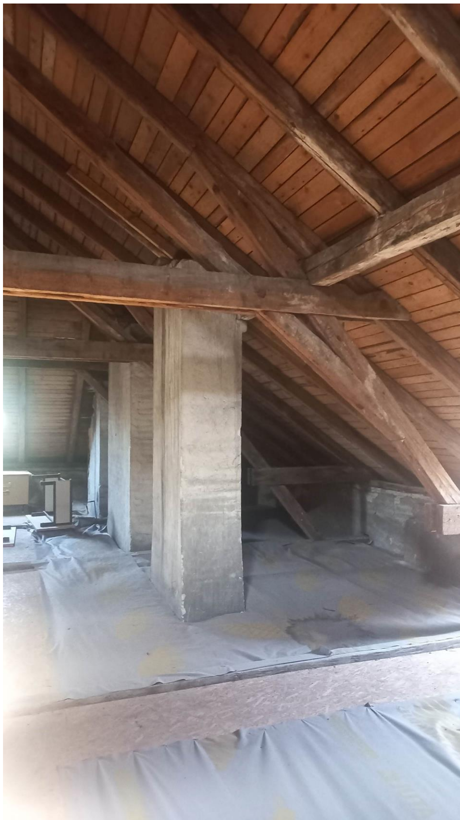
Obr. 1 – fotografie zatékání střešním pláštěm