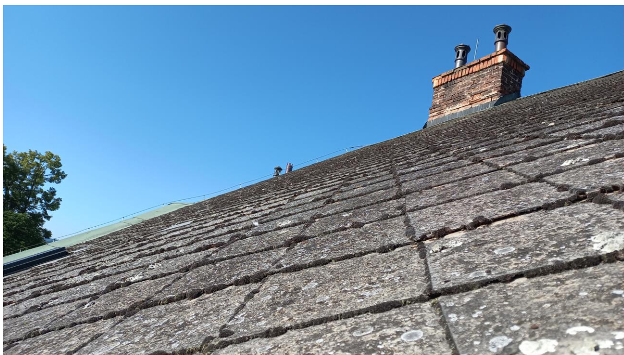
Obr. 5 – fotografie střešního pláště