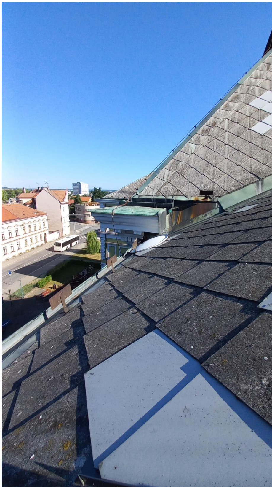
Obr. 6 – fotografie střešního pláště