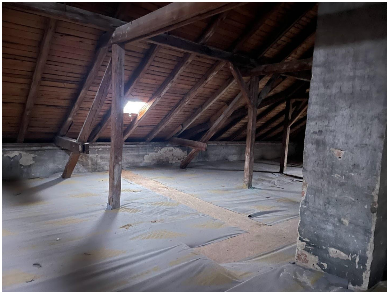
Obr. 4 – fotografie půdního prostoru