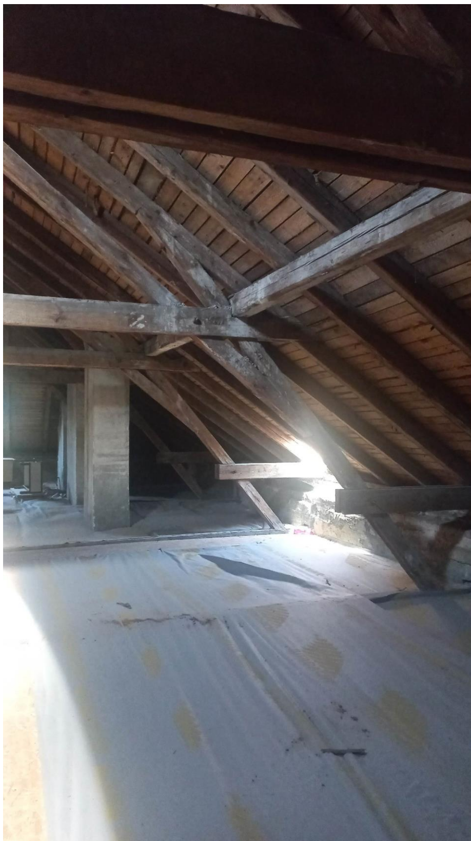
Obr. 2 – fotografie půdního prostoru